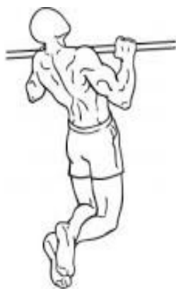
PRUEBA FUERZA PN