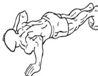
PRUEBA FUERZA GC